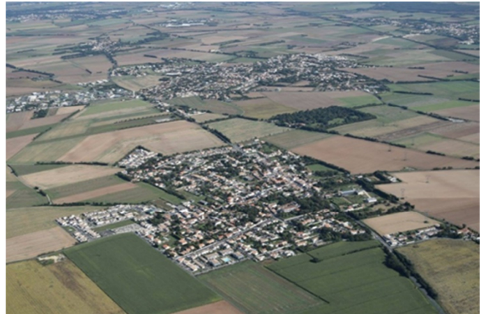
Vues aériennes de Clavette