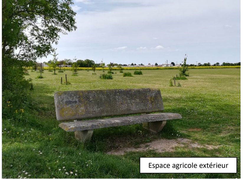
Espace agricole extérieur