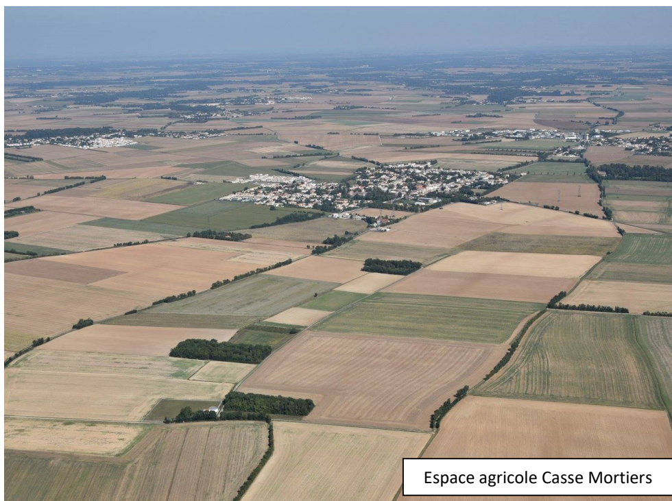
Espace agricole Casse Mortiers