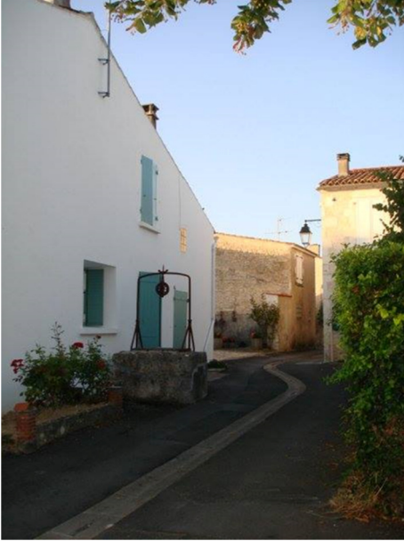
Cœur de village